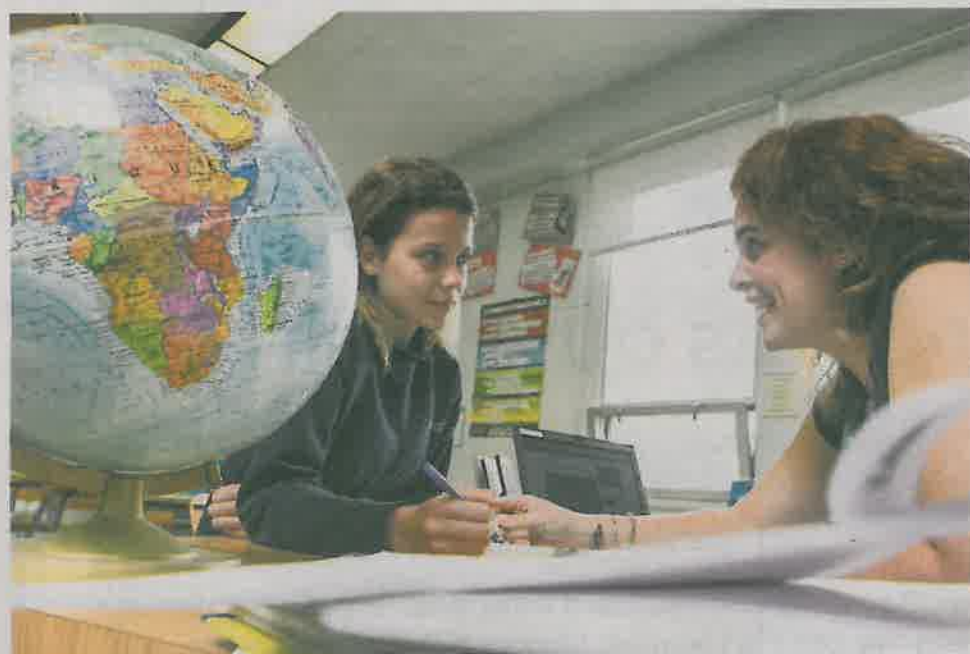
La CSRS est branchée sur des pratiques pédagogiques reconnues parmi les meilleures au Québec afin de favoriser la réussite et la persévérance de tous ses élèves.

Ces faits confirment bien que « La qualité est publique »!