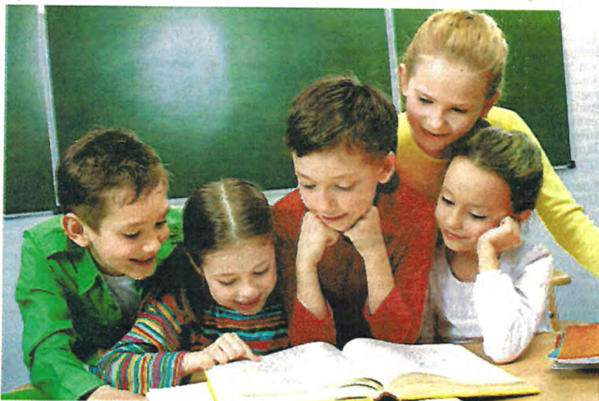
C'est en agissant ensemble que nous pouvons créer un impact, dans l'intérêt de nos jeunes qui formeront la relève de demain.

Agir envers nos jeunes, parce que la mobilisation doit mener vers des projets concrets afin